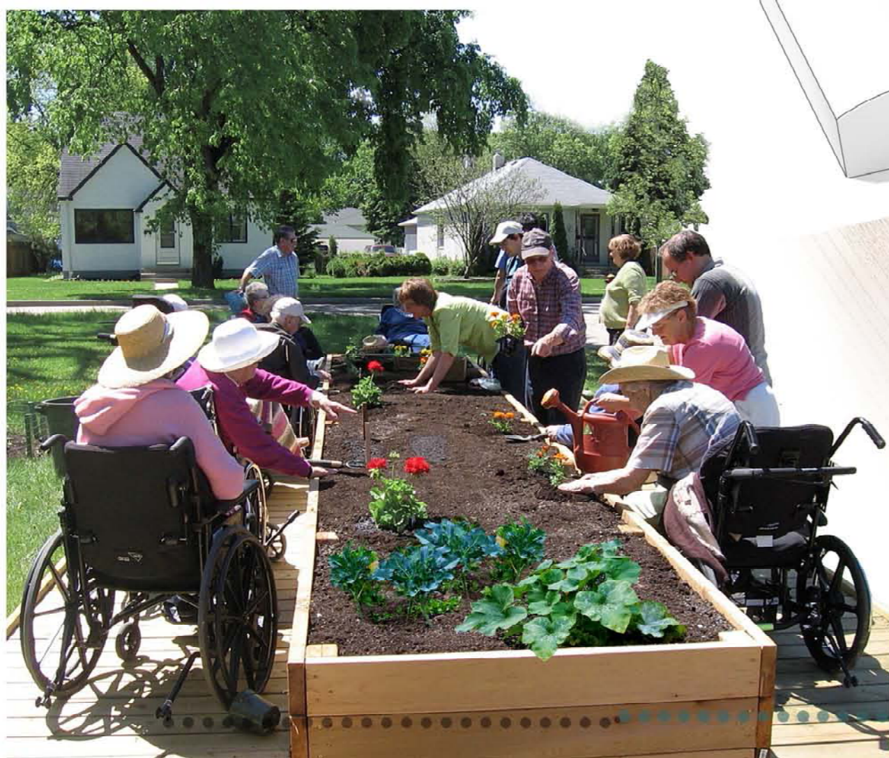
ORTI TERAPEUTICI - VASCHE APPPOSITAMENTE STUDIATE PER ESSERE FRUITE DA TUTTI