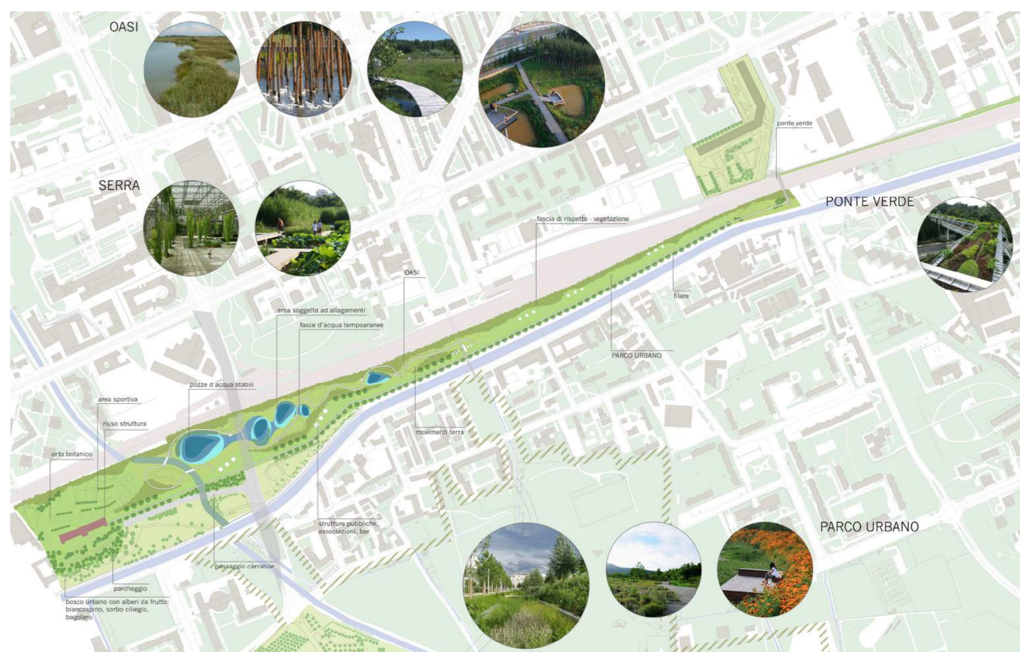
Simulazione di assetto per l'inserimento delle oasi, scalo in dismissione di S. Cristoforo.