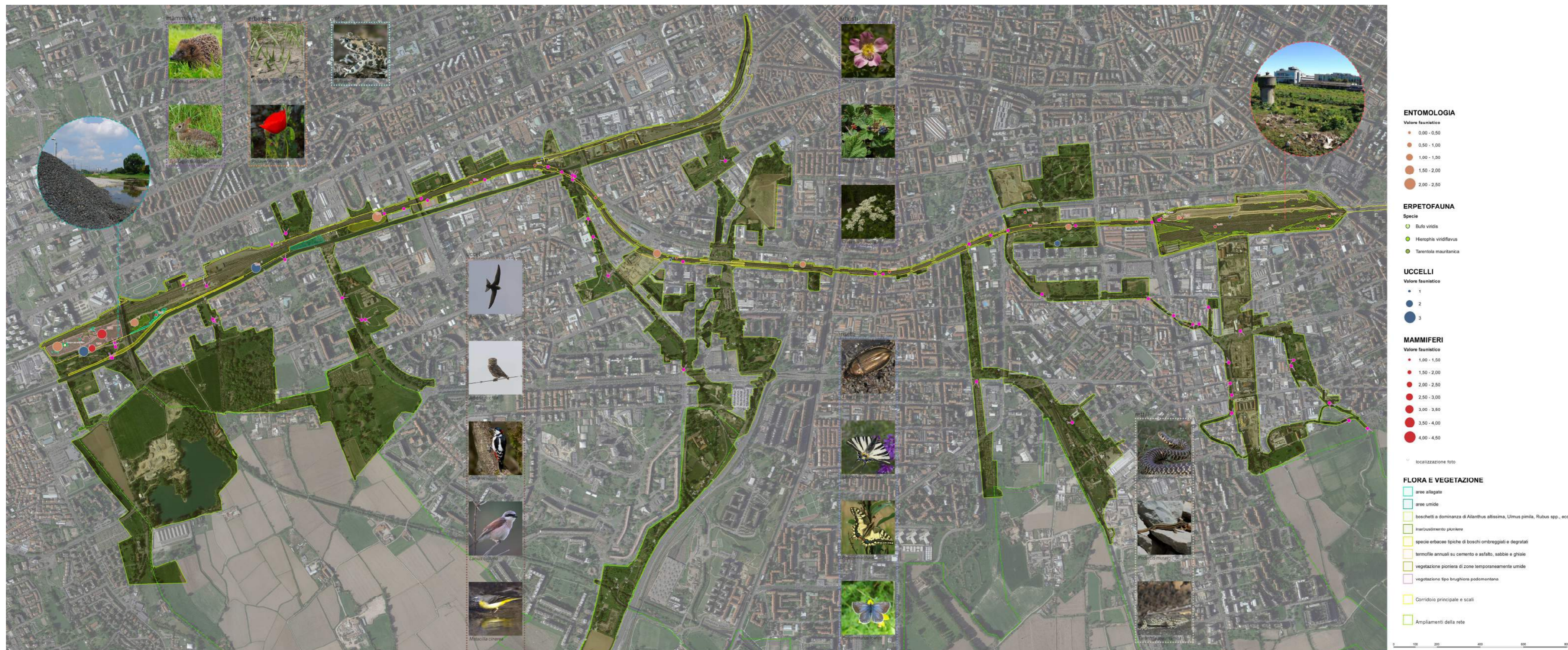
Rilievo naturalistico sulla cintura urbana Sud Milano, nella fascia compresa tra gli scali in dismissione di San Cristoforo e di porta Romana, integrato con le estensioni verso il Parco Sud della rete ecologica urbana. Il progetto interessa le aree ferroviarie in dismissione (per le parti di cui è previsto l'uso pubblico) e quelle ancora in esercizio (come elemento di connessione ecologica).

Si tratta di uno studio di fattibilità che è stato concluso e che sarà attuato in attraverso l'inserimento in strumenti pianificatori in attuazione del PGT, in particolare sulle aree ferroviarie, e regolamenti: regolamento del verde, linee guida di gestione per la fascia ferroviaria in esercizio. Parte della proposta, lungo le connessioni trasversali, si articola su spazi verdi esistenti.