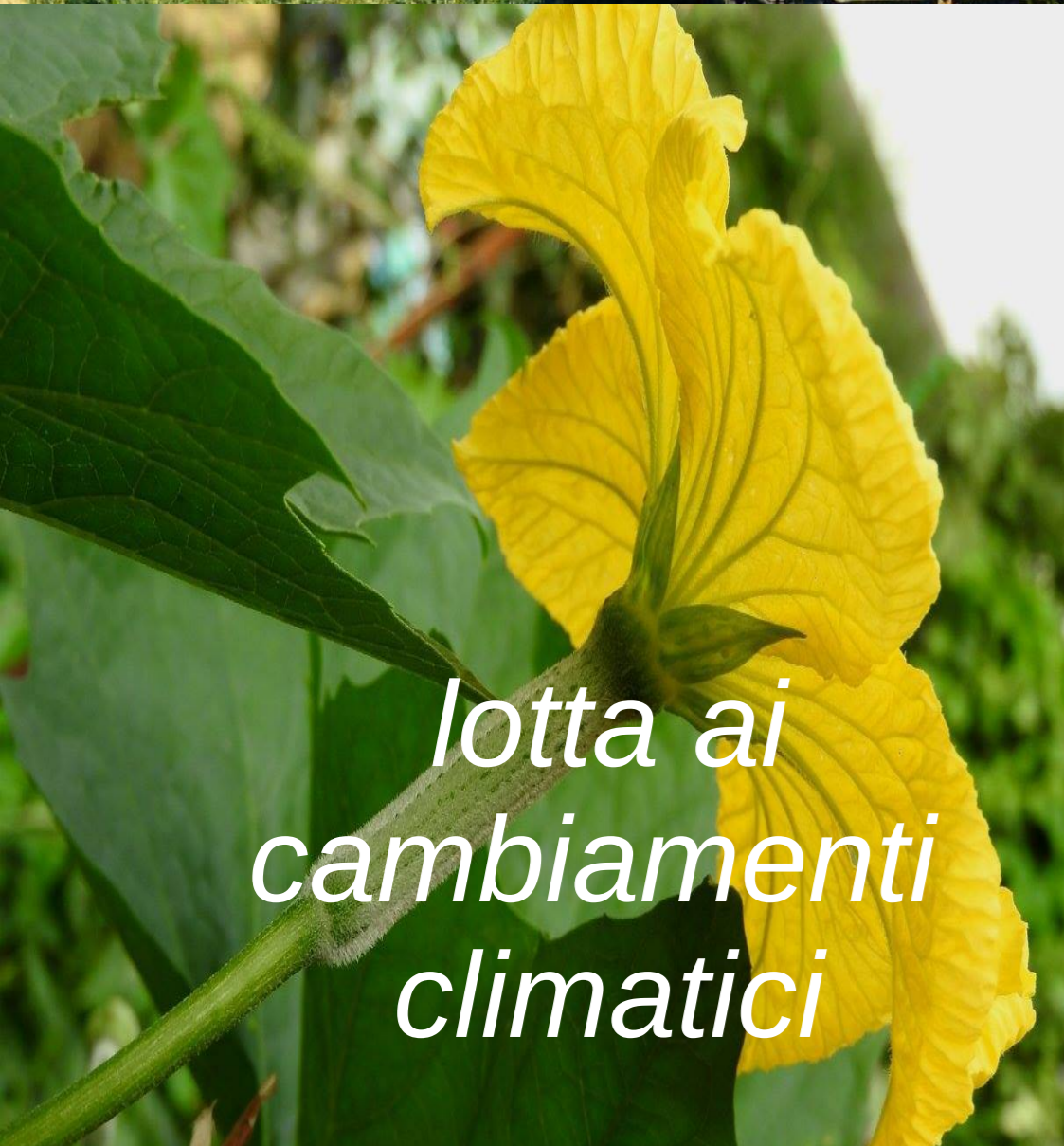
lotta ai cambiamenti climatici

cura della terra – cura della persona – cura della natura – cura della comunità – cura del bene comune -